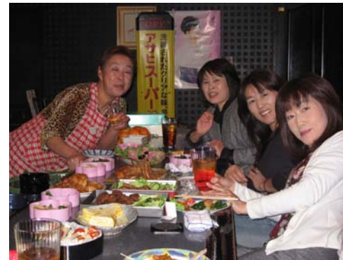
忘年会「第一号」みんな元気

12月2日（日）夕方6時から、南部支部外渕・浅草班の合同忘年会をAさんのお店で5人が参加して行ないました。婦人ならではのアイデアで、それぞれが一品ずつ持ち寄り、各家庭の味を堪能できるのも楽しみの一つ。民商歴の長い会員さんばかりで、入会後に民商の事務所が2回も引越し。地元にあった事務所がだんだん遠くなっていく——とのボヤキも。